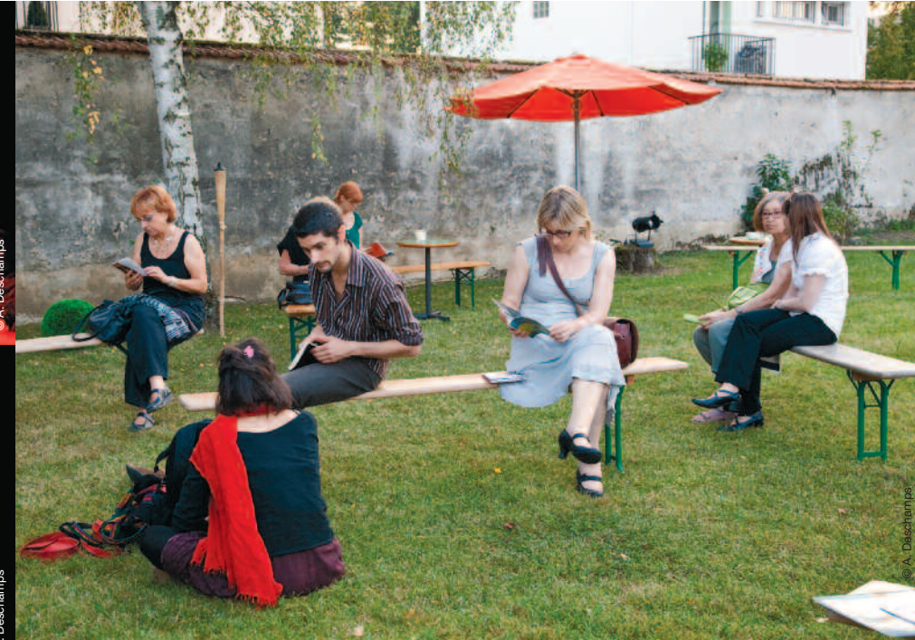
En Val-de-Marne, le conte à sa Maison...